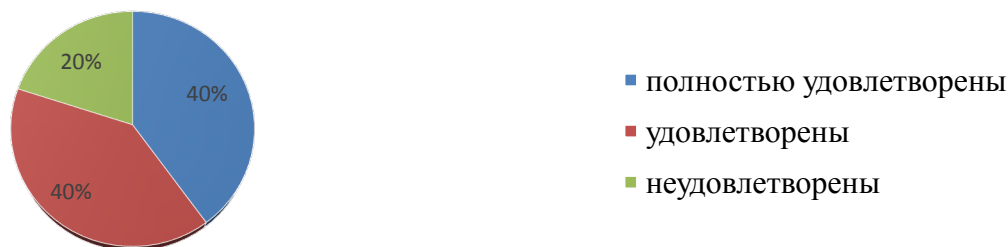
Удовлетворенность дополнительным образованием в 2021 году

ВЫВОДЫ: Воспитательная программа школы, реализуется через комплекс мер, направленных на воспитание и социализацию обучающихся, через подпрограммы, определяет содержание и организацию воспитательного процесса на ступени начального, основного и среднего общего образования. Программа «Воспитание и социализации обучающихся» предусматривает формирование нравственного уклада школьной жизни, обеспечивающего создание соответствующей социальной среды развития обучающихся и включающего воспитательную, учебную, внеучебную, социально значимую деятельность обучающихся, основанную на системе традиционных моральных норм, реализуемых в совместной социально- педагогической деятельности школы, семьи и других субъектов общественной жизни.